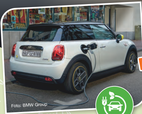
MINI Cooper SE vollelektrisch